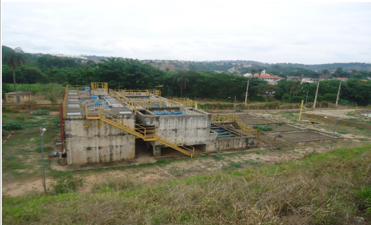
Visão geral da ETE