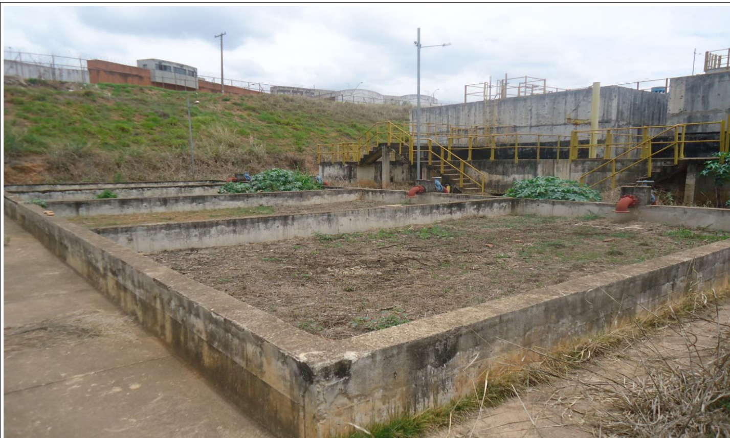
Leito de Secagem