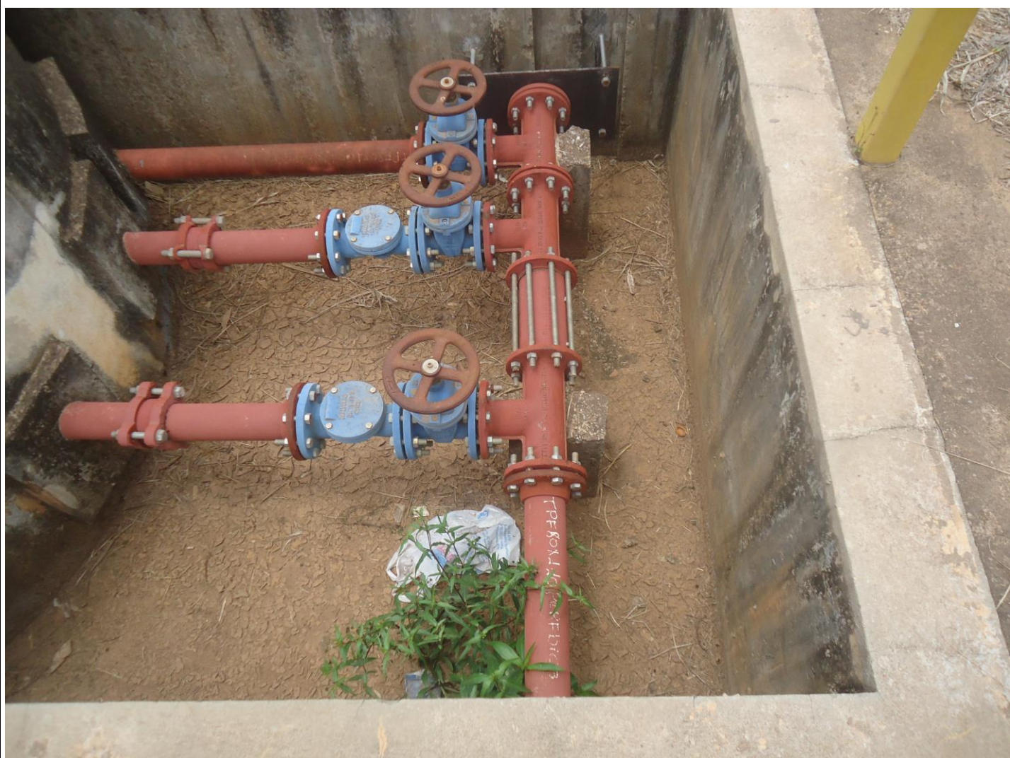
Elevatória de recirculação do lodo