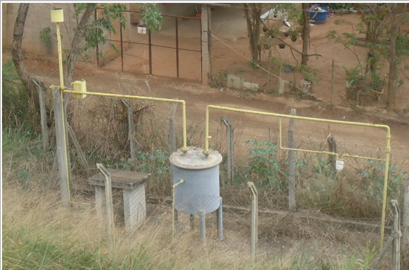
Queimador de gás