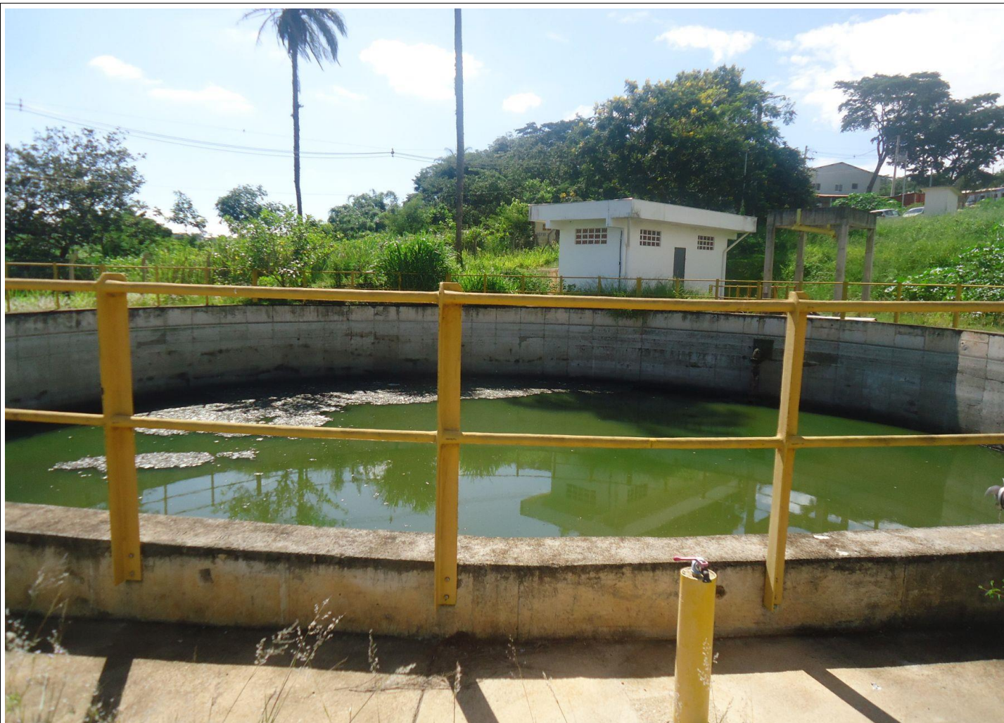
Tanque de Equalização