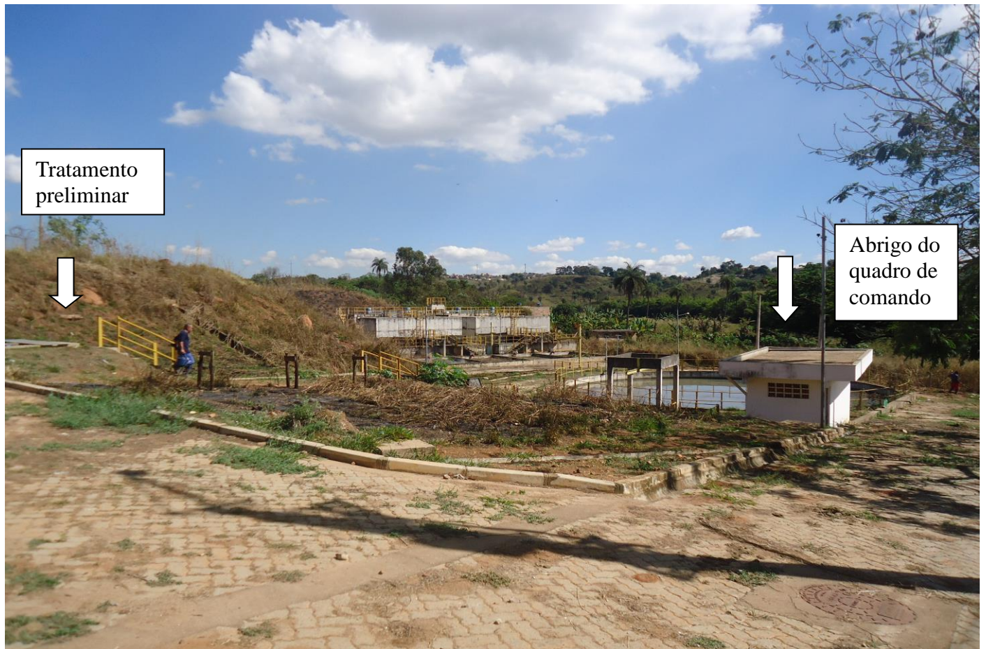
Visão geral da ETE