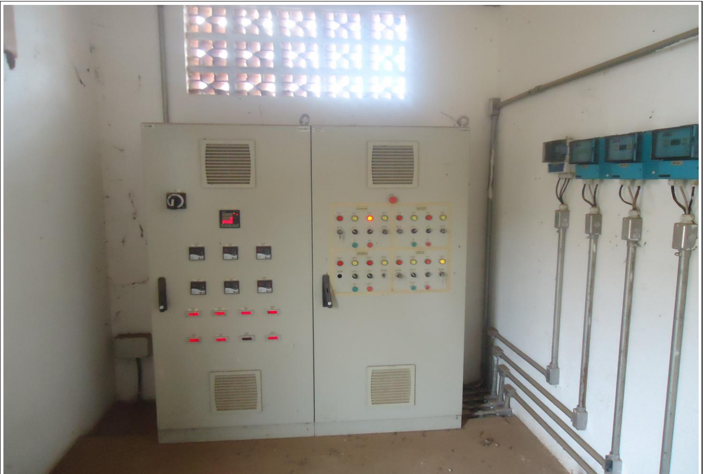
Quadro de Comando