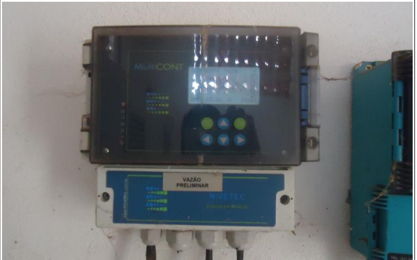
Medidor de Vazão via sensor instalado na calha do tratamento preliminar