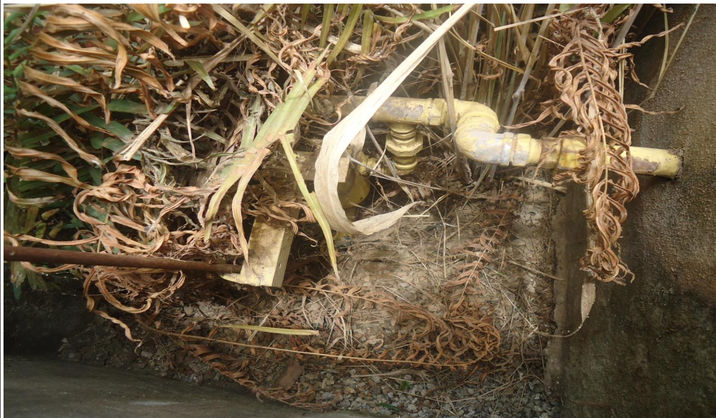
Drenos do queimador de gás