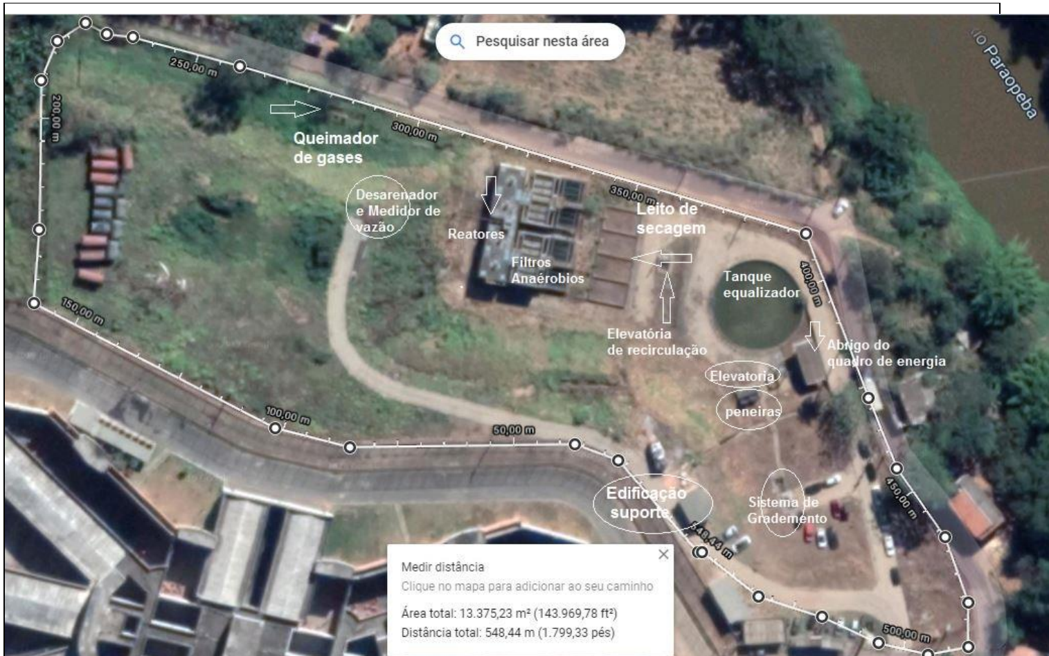
Visão geral da ETE