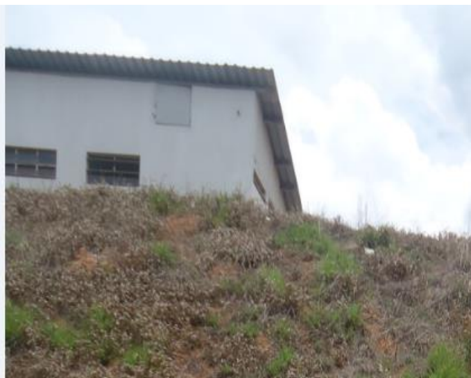
Edificação suporte contendo: Laboratório, Banheiro, quarto para ferramentas, espaço refeitério