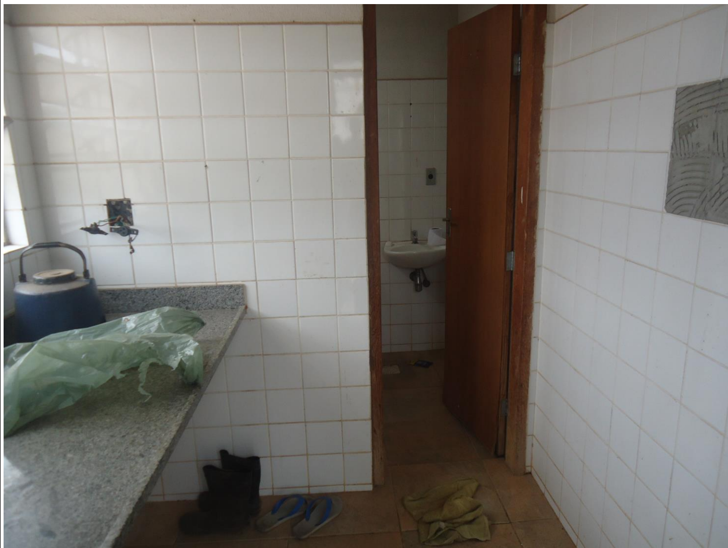
Laboratório, bancada para ensaio do cone Imhoff e instalação do peagâmetro.