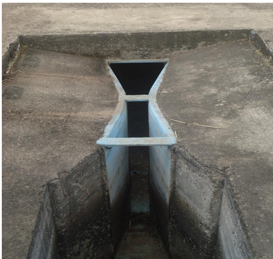
Medidor de vazão após desarenador