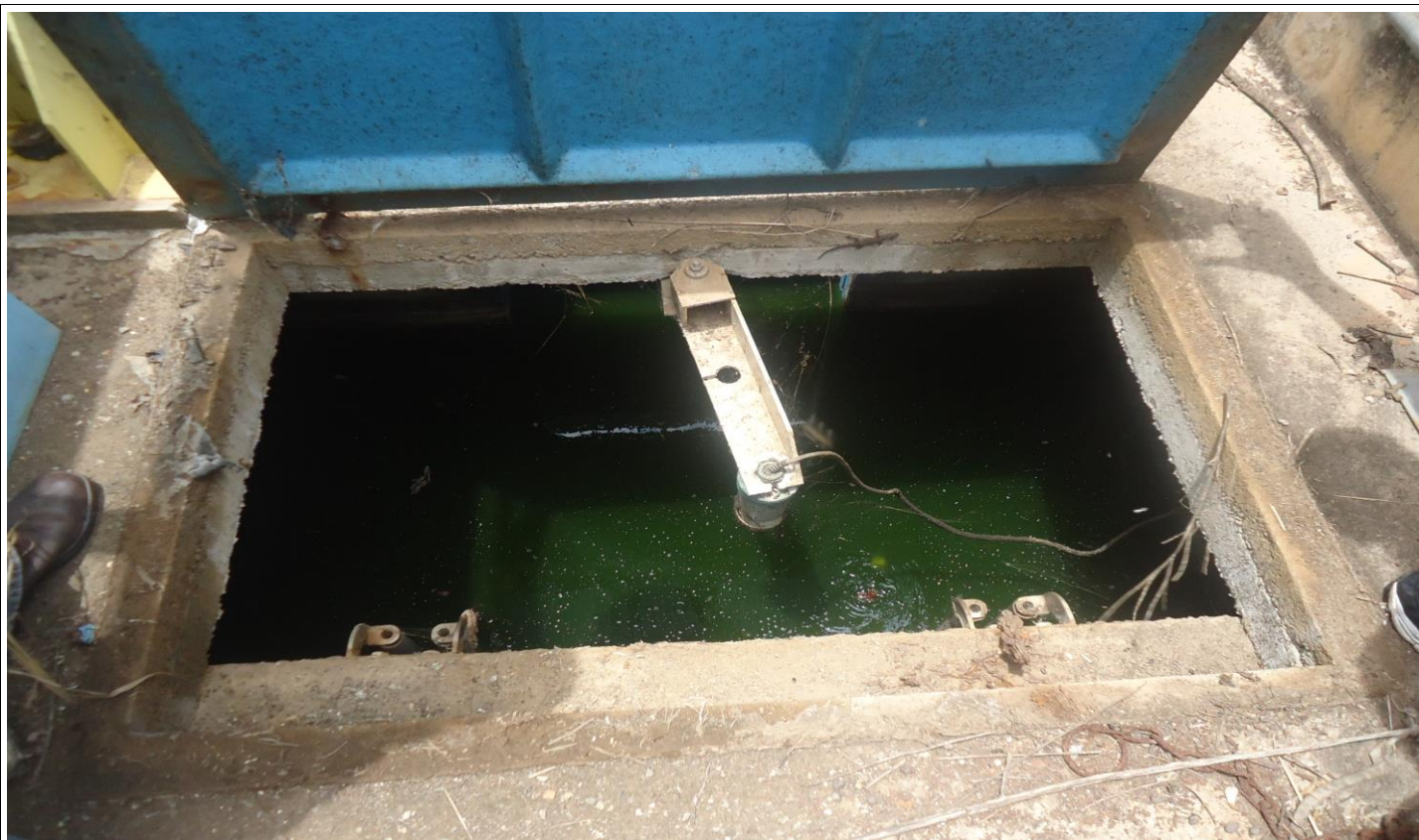
Elevatória de recirculação do efluente