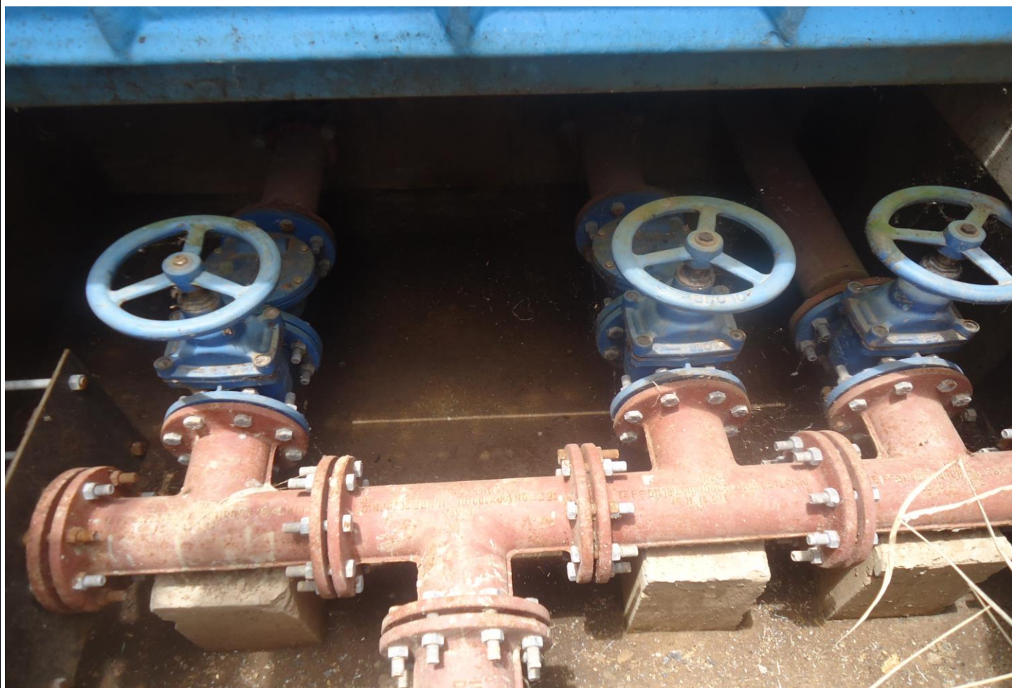
Elevatória de recirculação do efluente