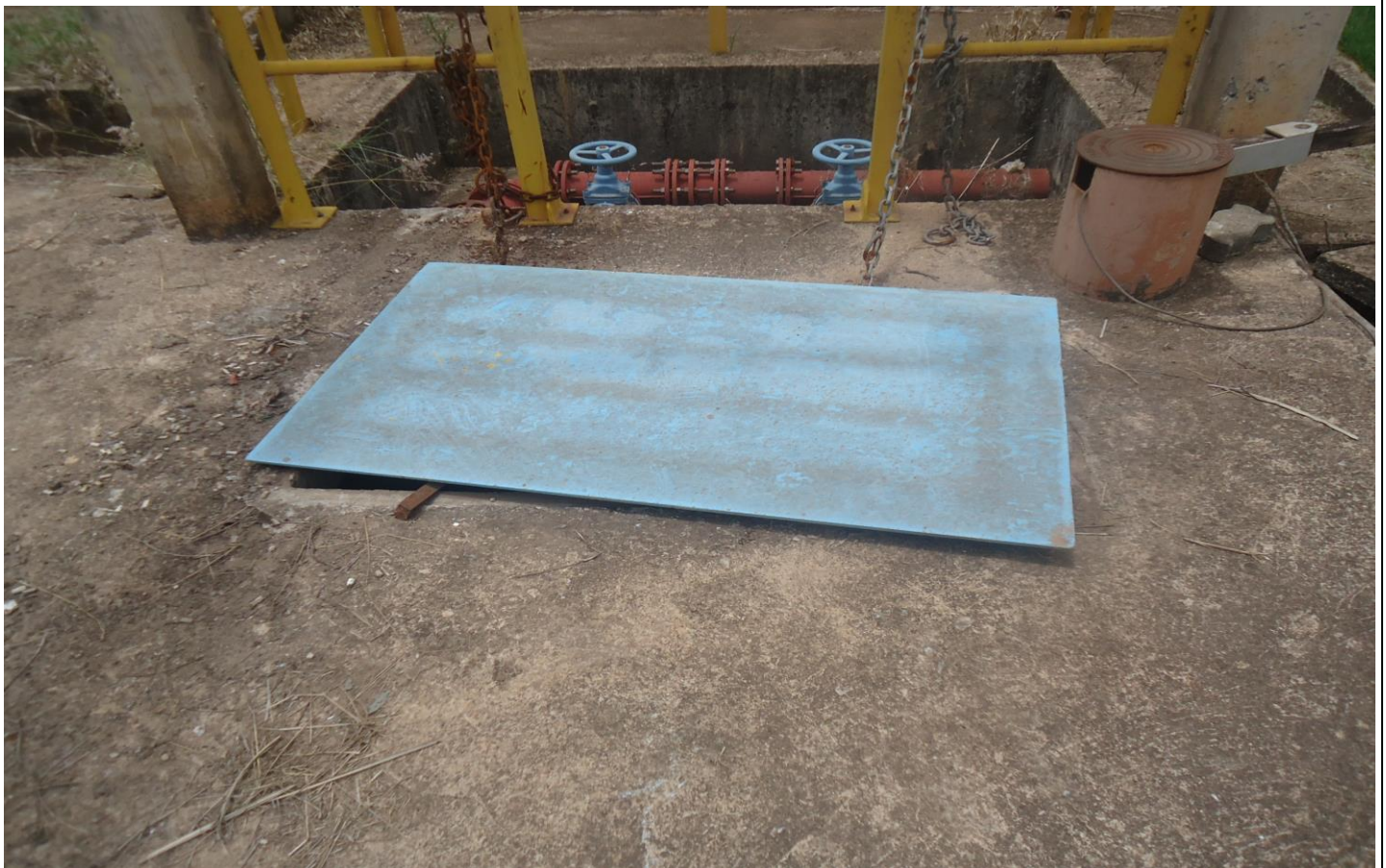
Elevatória de Circulação