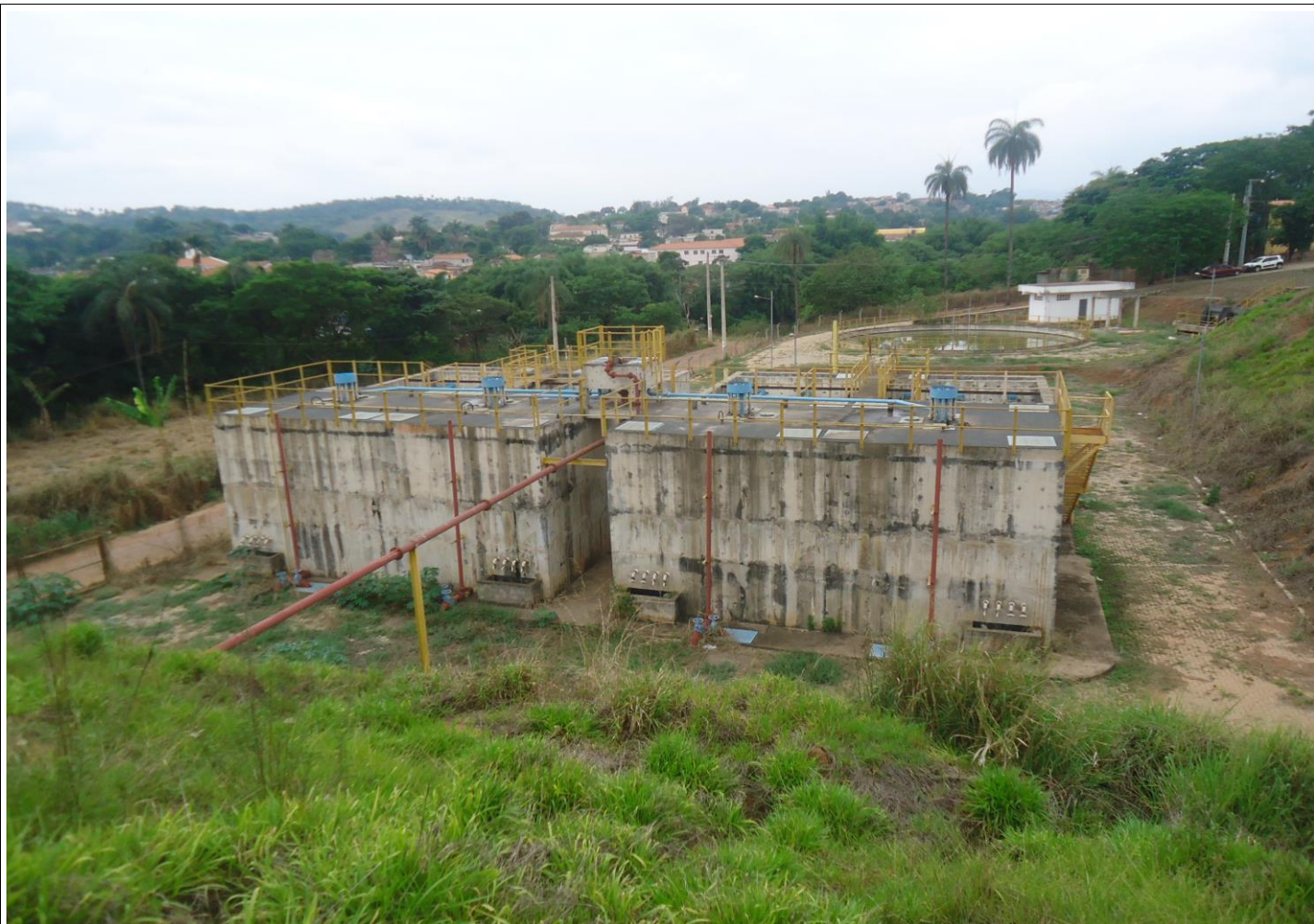
Visão geral da ETE