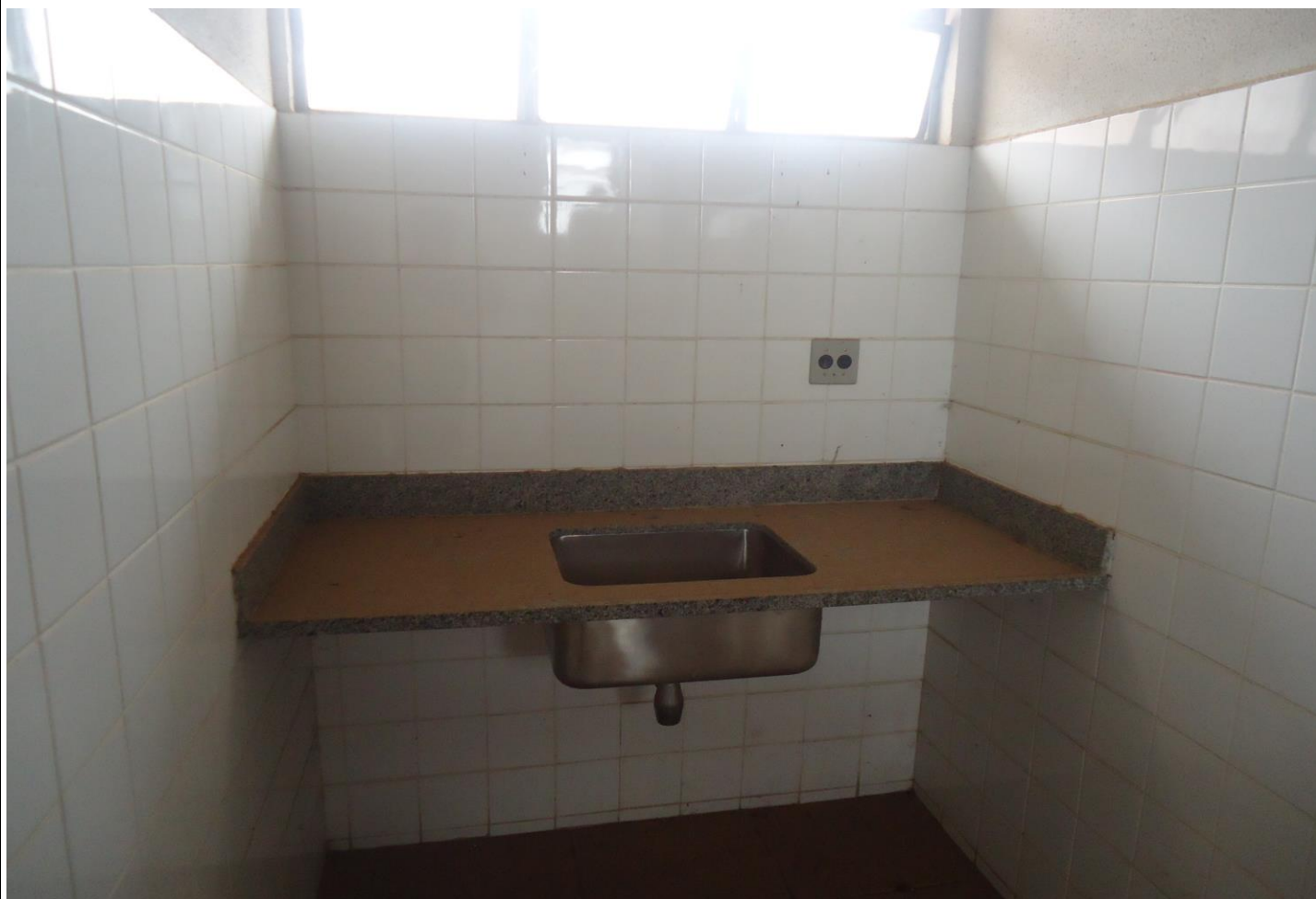
Espaço refeição para funcionários da ETE