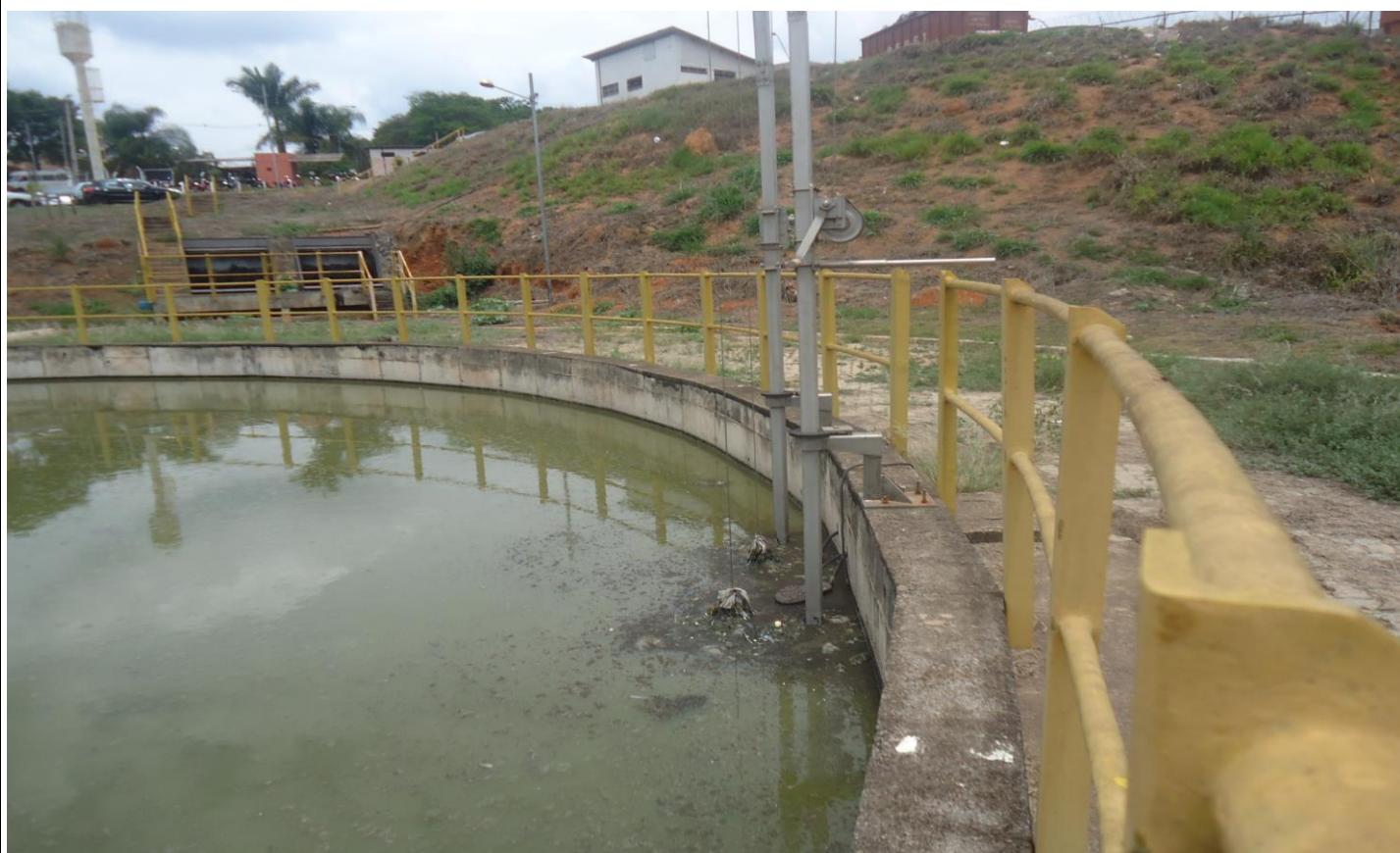
Tanque de Equalização